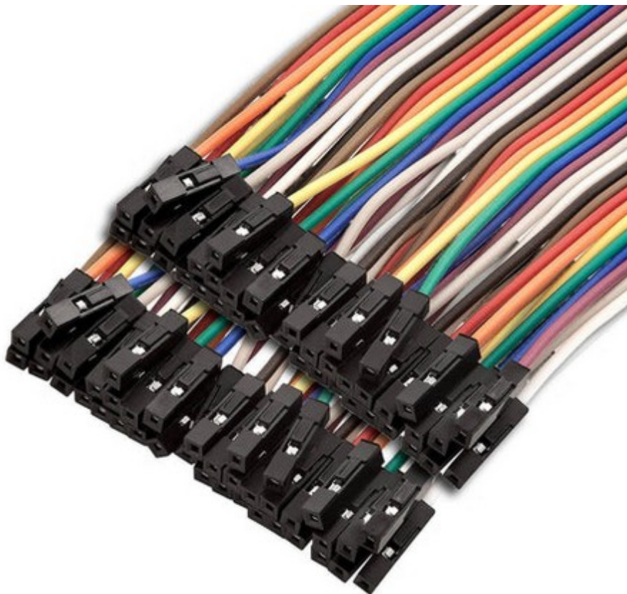
Arduino-Kabel (Buchse – Buchse) Arduino cable (female – female)